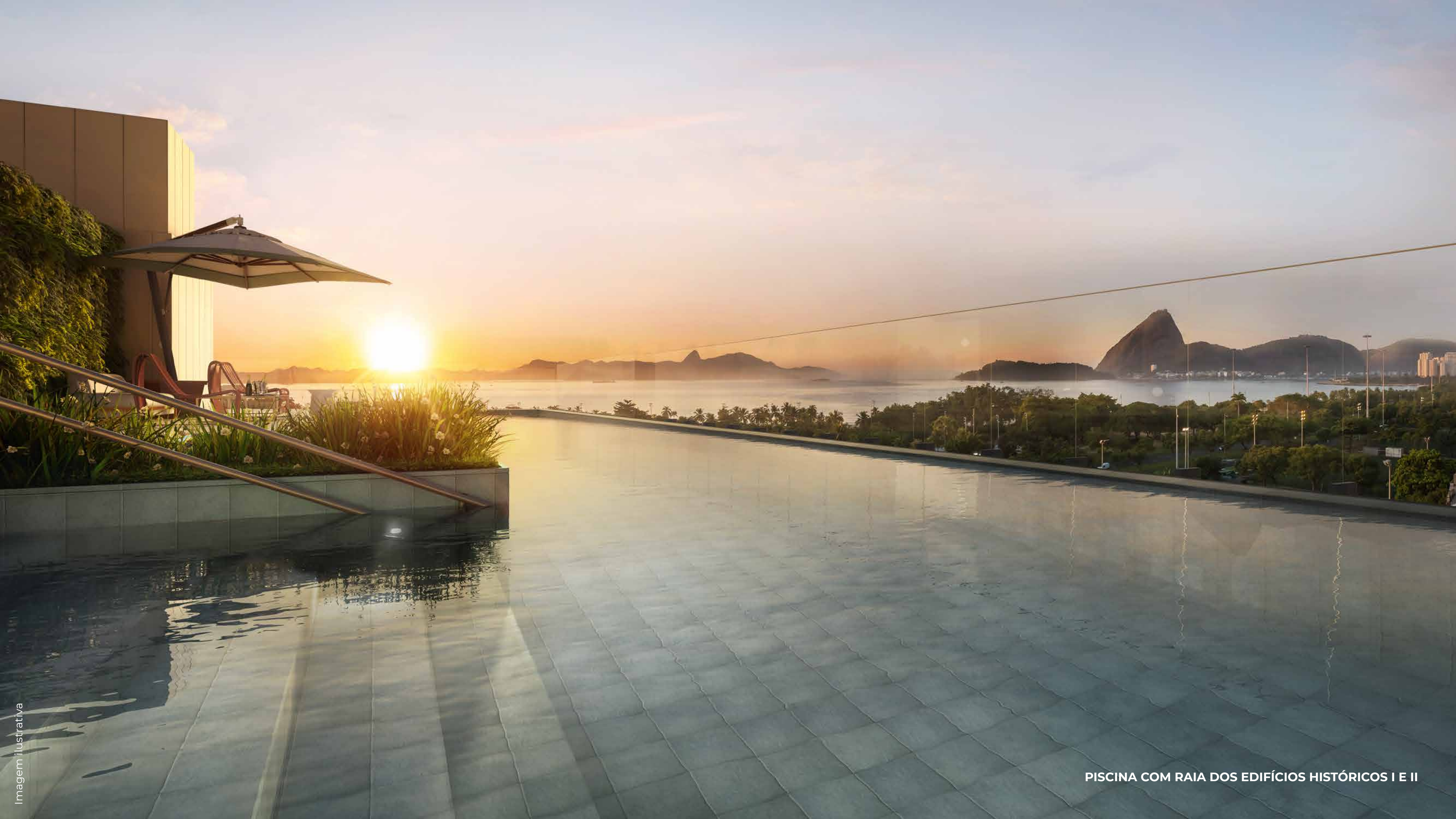
PISCINA COM RAIA DOS EDIFÍCIOS HISTÓRICOS I E II