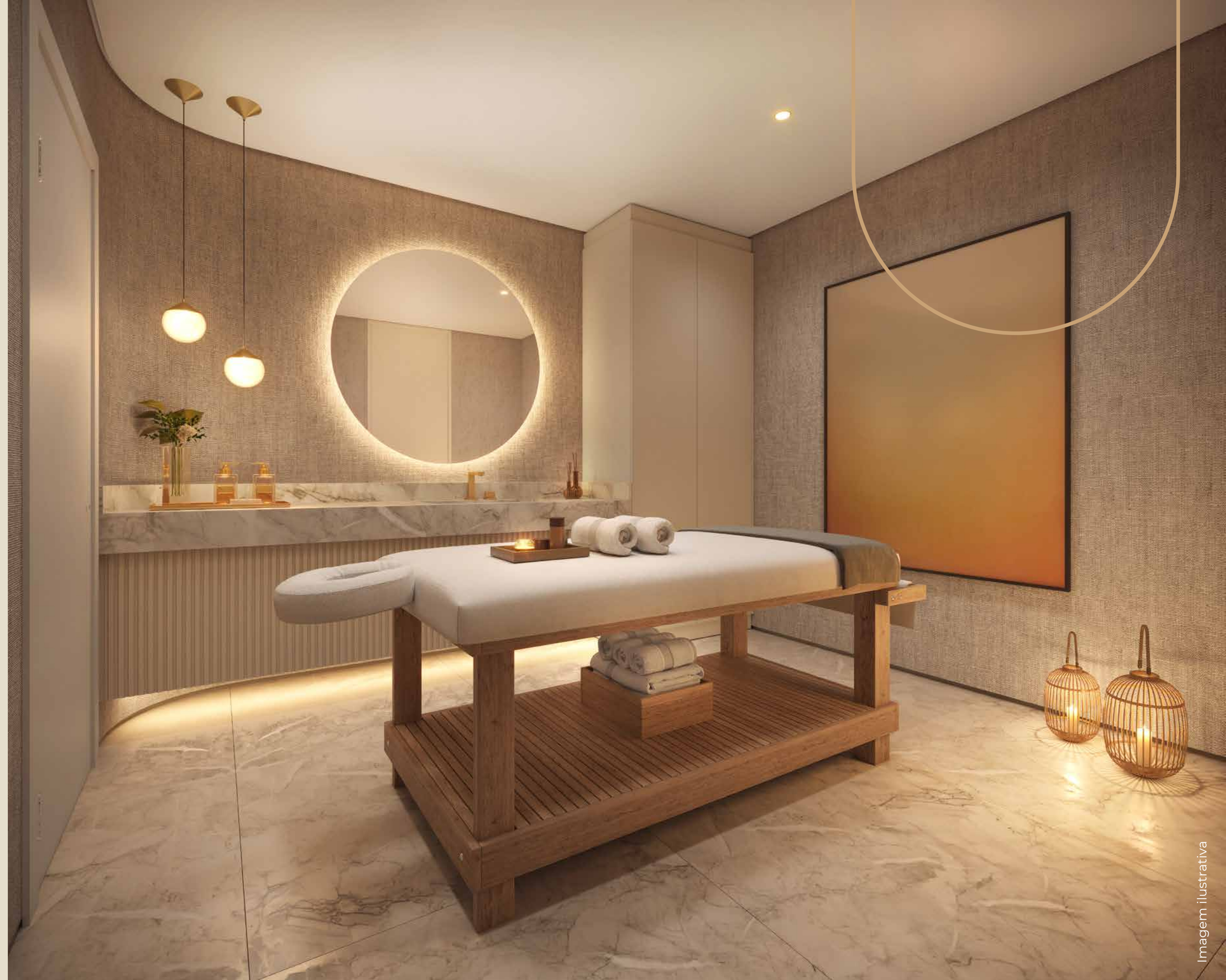
SALA DE MASSAGEM DOS EDIFÍCIOS HISTÓRICOS I E II