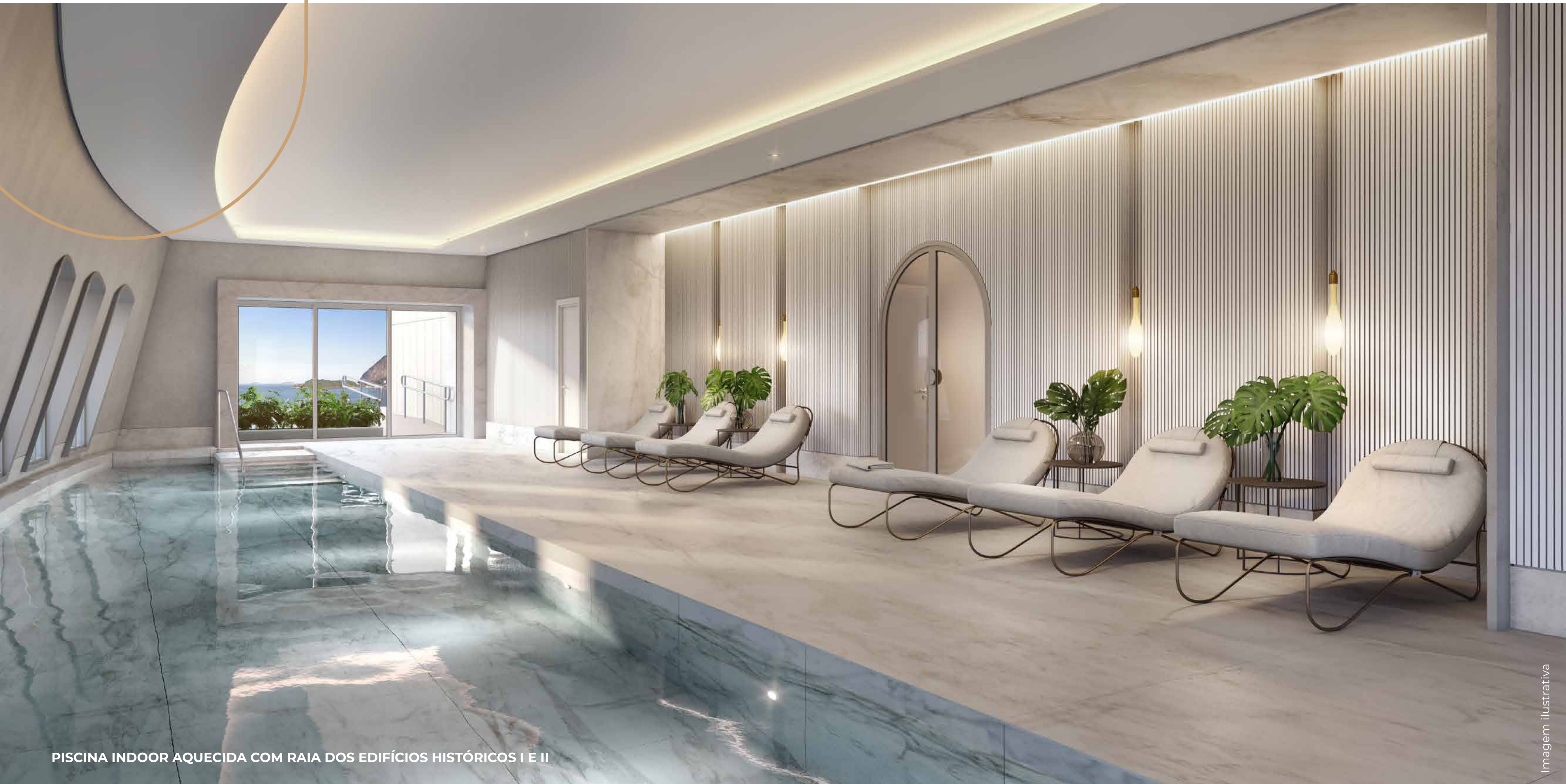
PISCINA INDOOR AQUECIDA COM RAIA DOS EDIFÍCIOS HISTÓRICOS I E II