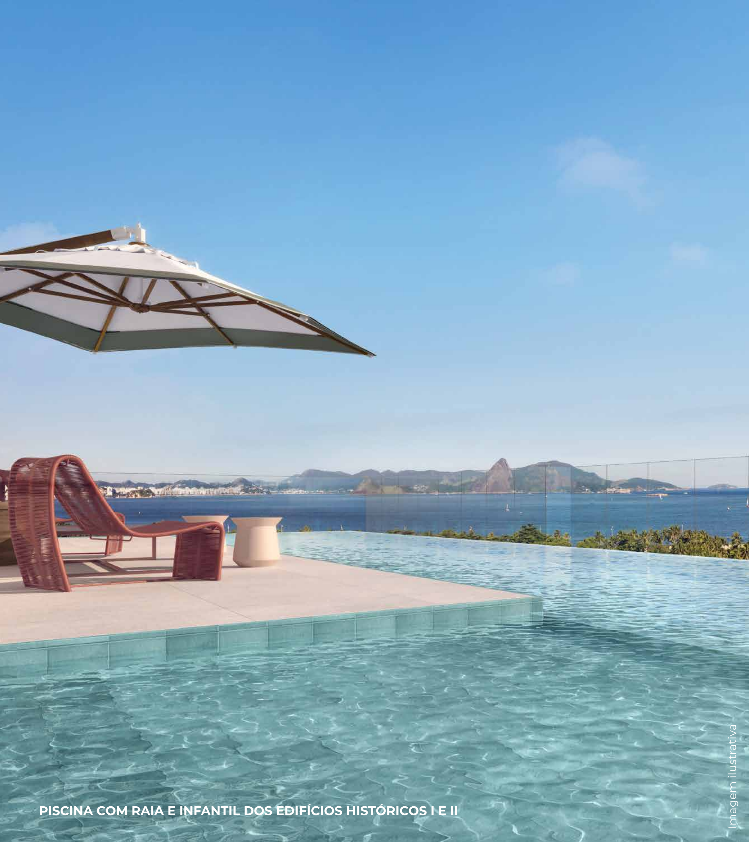
PISCINA COM RAIA E INFANTIL DOS EDIFÍCIOS HISTÓRICOS I E II