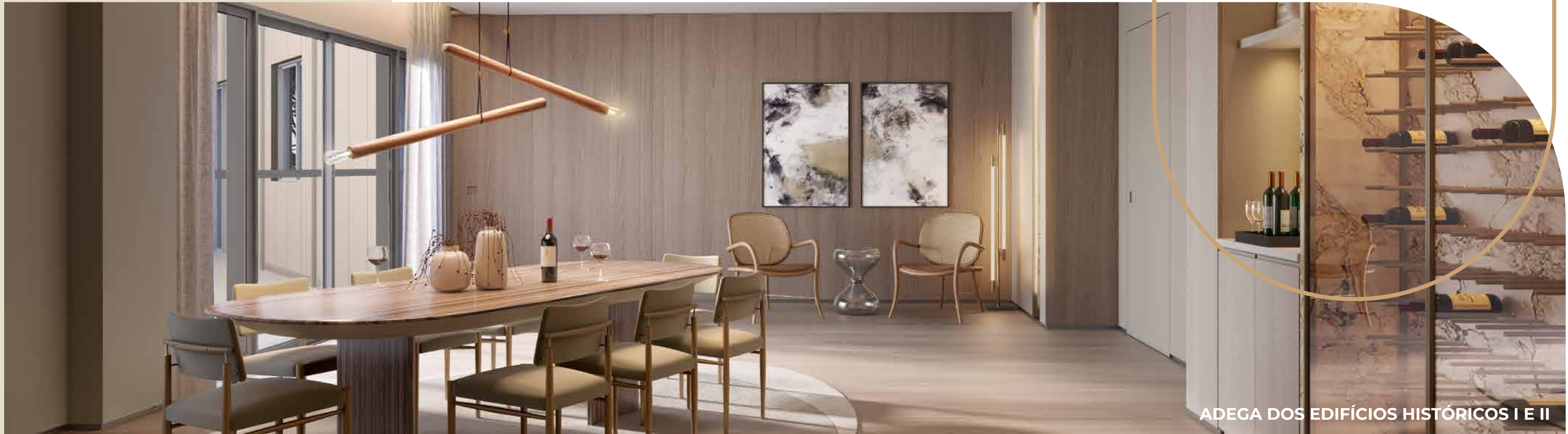
ADEGA DOS EDIFÍCIOS HISTÓRICOS I E II