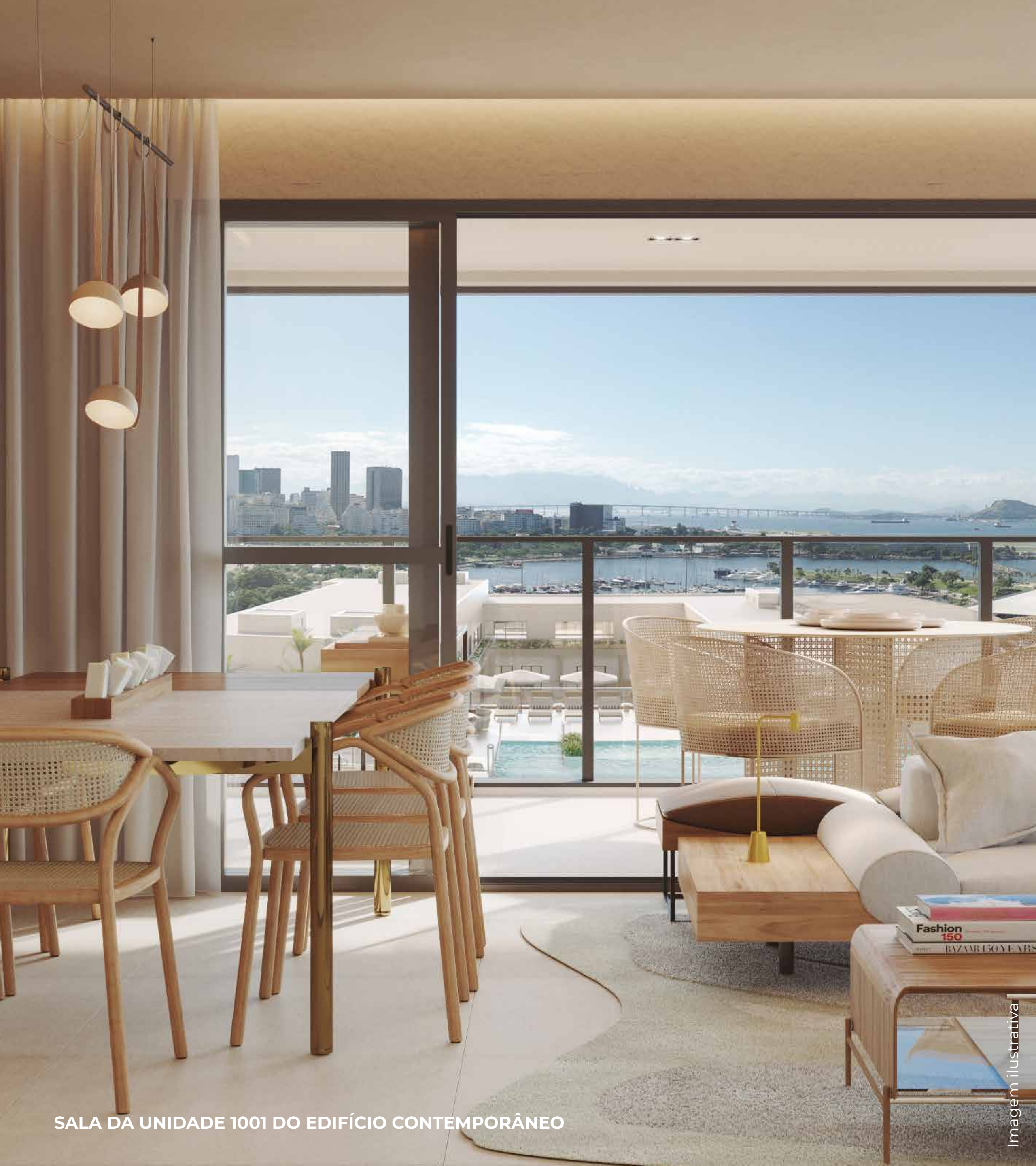
SALA DA UNIDADE 1001 DO EDIFÍCIO CONTEMPORÂNEO