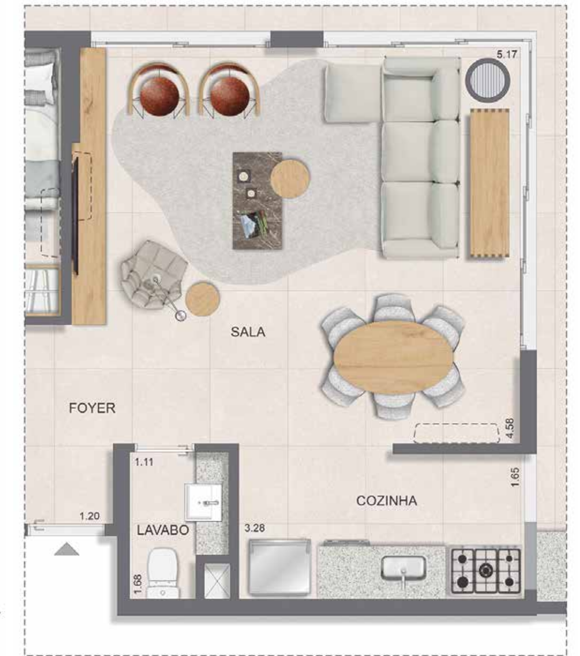
OPÇÃO SALA AMPLIADA