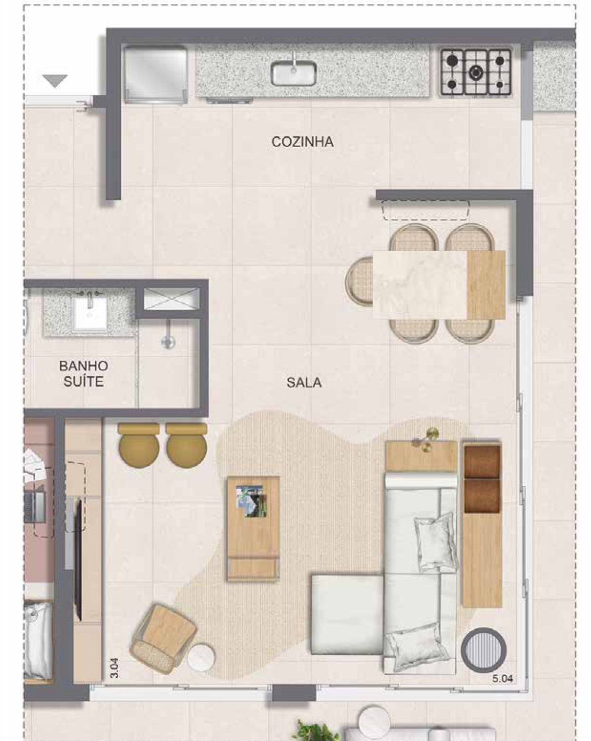
OPÇÃO SALA AMPLIADA