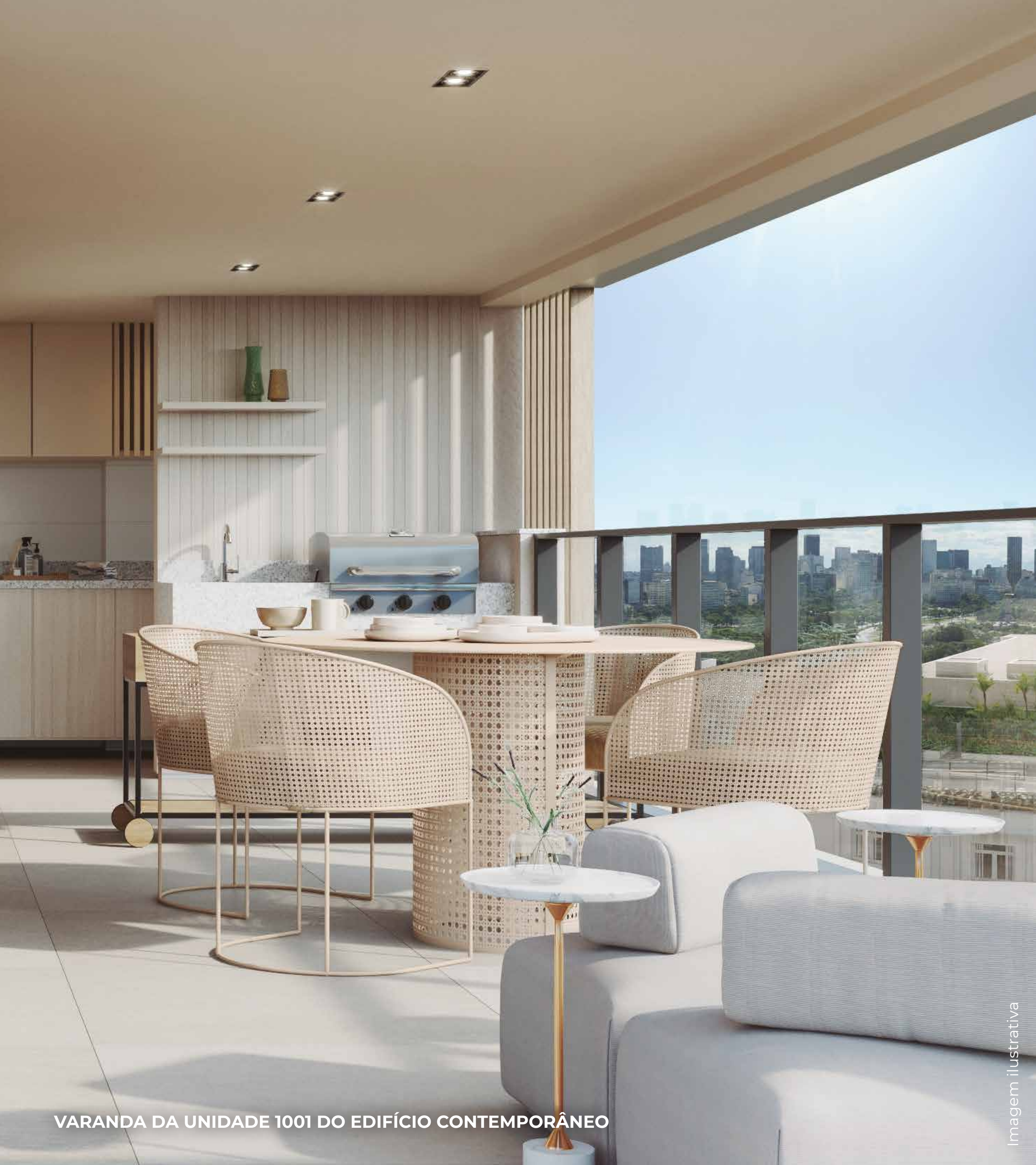
VARANDA DA UNIDADE 1001 DO EDIFÍCIO CONTEMPORÂNEO